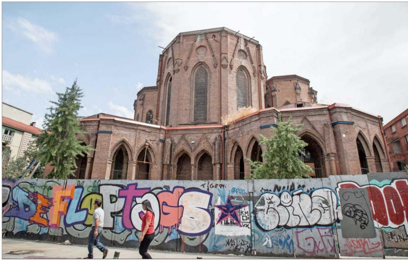
Exterior del Monumento Nacional. Julieta Brodsky, ministra de las Culturas, afirma que "nuestro Gobierno está respondiendo a un compromiso del Estado con las comunidades del Barrio Brasil por la importancia de su valor patrimonial".