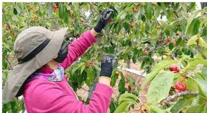
Un extranjero puede recibir en temporada de cosecha de cerezas, hasta 70 y 100 mil pesos diarios. Son reconocidos por su capacidad de extracción.

contratan los servicios de inmigrantes, realizan el pago de las cotizaciones sobre el rut provisorio que las AFP o Fonasa otorgan al ingresar a la página web, con el número de pasaporte. Y si bien concuerda que a nivel país hay una situación compleja en torno al proceso migratorio por la entrada irregular de personas de otras nacionalidades, “jamás hemos hecho uso ni abuso de los inmigrantes para bajar los costos de producción, eso es una afrenta gratuita que solamente habla de ignorancia”.