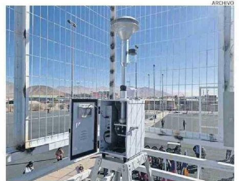
CODELCO INFORMÓ QUE RETIRARÁ 4 TONELADAS DE MATERIAL PARTICULADO.

"Es preocupante que mientras no se cuente con un nuevo Plan de Descontaminación Atmosférica para Calama tengamos medidas parches, y anula-