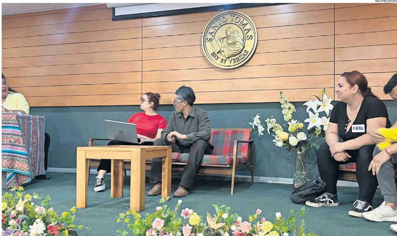
LA OBRA CON HUMOR Y EDUCACIÓN AYUDA A L ESPECTADOR A ENTENDER MEJOR EL TEMA DE LA PREVISIÓN SOCIAL

La agrupación se presentará en el Ex Casino con su obra que llega a la ciudad luego de recorrer distintos puntos.