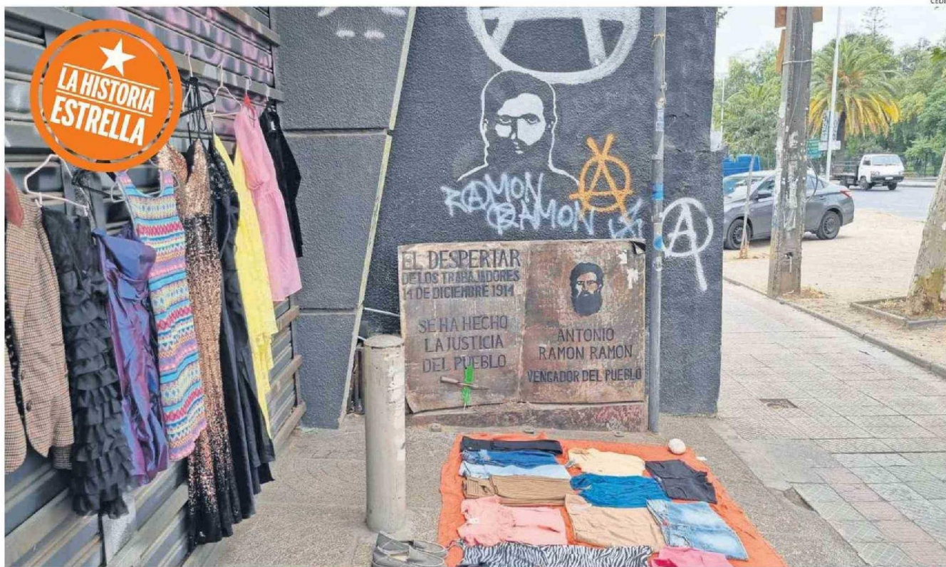
JUSTO AL COSTADO A LA ENTRADA DE UNA FARMACIA ESTÁ UNA PLACA RECORDATORIA, A PASOS DEL METRO RONDIZZONI.