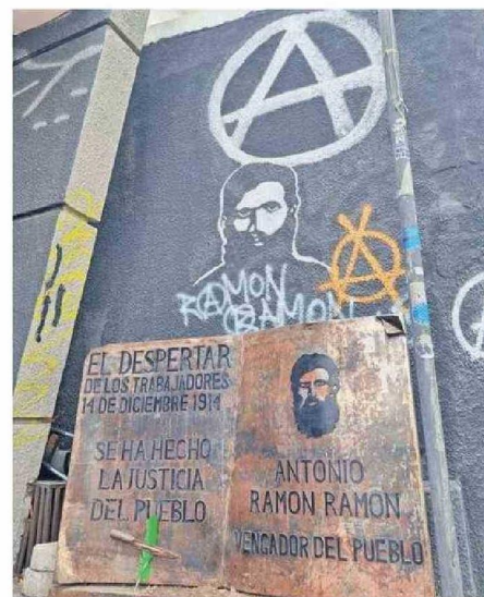
LA PLACA AL VENGADOR DEL PUEBLO.

Teorías hay varias. Algunas dicen que colectivos anarquistas lograron su liberación y le pagaron un pasaje de regreso a España en 1922, país en el cual fallecería en 1924. Otros, que se suicidó estando en la cárcel por pasar una profunda depresión, otros simplemente apelan a que fue ejecutado al poco tiempo de ocurrir el