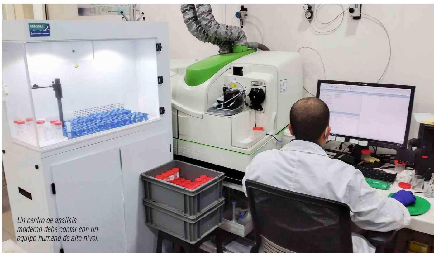
Un centro de análisis moderno debe contar con un equipo humano de alto nivel.