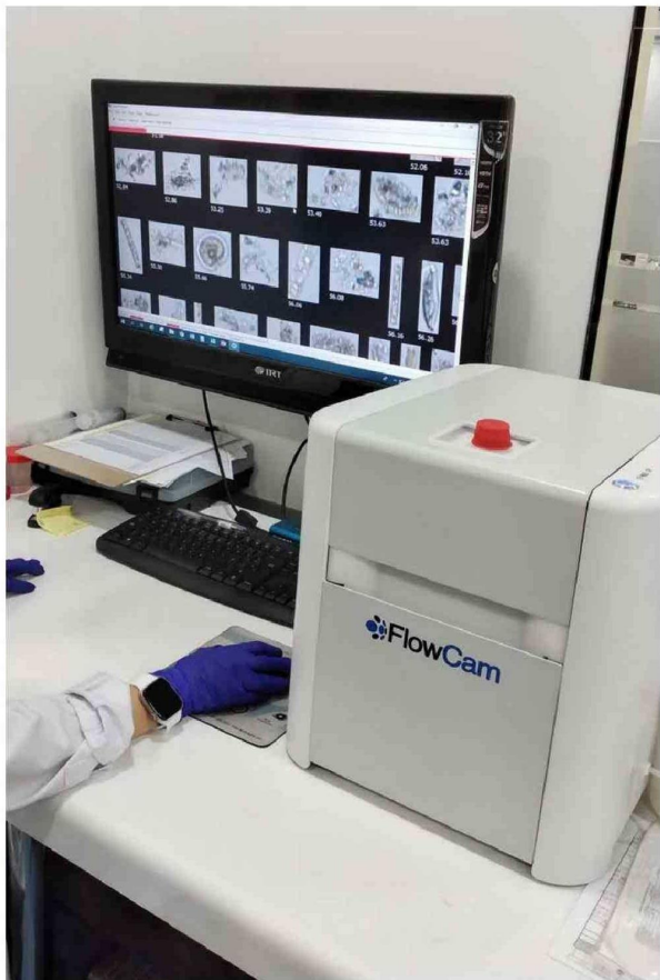
Los equipos modernos permiten detectar y cuantificar contaminantes a niveles traza.

→ y, con ello, minimizando la posibilidad de errores en las áreas de calidad, laboratorio, operaciones, comercial, y administración y finanzas”.