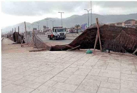
EL CIERRE PERIMETRAL FUE DERRIBADO Y POR AHÍ INGRESAN A LA ZONA EN DONDE SE ENCUENTRAN LAS NUEVAS OBRAS.