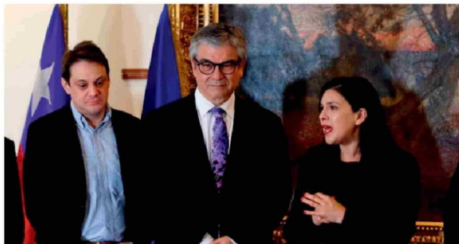
El ministro de Hacienda, Mario Marcel, entregó ayer el proyecto de Presupuestos a la Cámara.

¿Cómo se llegará a cumplir? Eso preguntó el