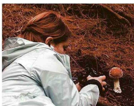
EL "FUNGITURISMO" ES UNA PRÁCTICA INTERNACIONAL.

-En la Región de Valparaíso, ¿cuáles son los hongos más comunes? ¿Hay algunos comestibles?