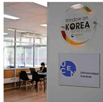
La biblioteca Window on Korea tiene una selección destacada sobre Corea y Asia.