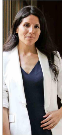
María José Gatica, senadora del comité de Renovación Nacional.