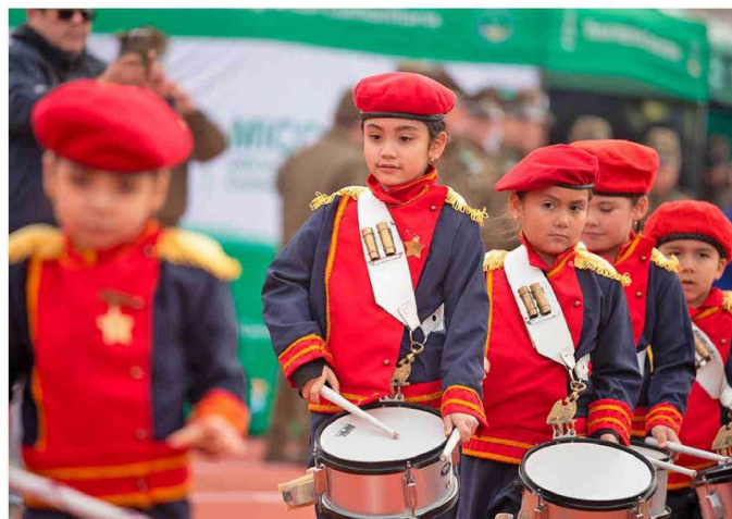
Los más pequeños también fueron parte de la jornada.

Se indicó que este evento es parte del constante acercamiento de Carabineros a la comunidad.