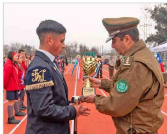
Contentos los colegios ganadores recibiendo su premio.