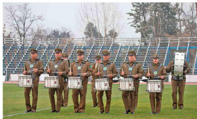
Fue una entretenida jornada en torno a los compases de las bandas de guerra.