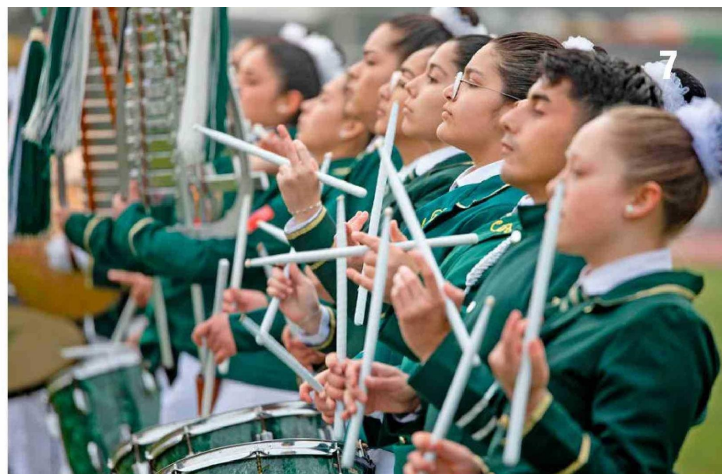
Todos los escolares demostraron su talento durante sus presentaciones.

perseverancia, entre otros que para nosotros como Carabineros y la comunidad son importantes", aseveró. En la oportunidad, agradeció la masiva participación de los colegios, y "el apoyo incondicional de los padres y apoderados para acompañarlos en este proceso".