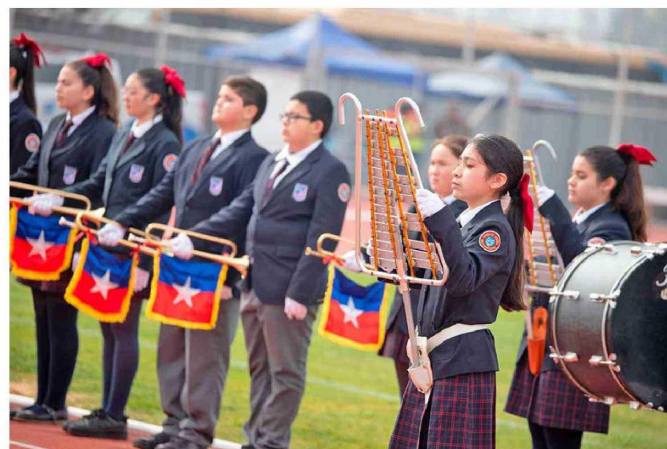
Fue una grata jornada de Concurso de Bandas Escolares de Guerra.