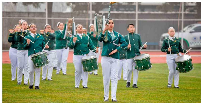
Impecables presentaciones de las bandas participantes.

Tiraje: 5.000 Lectoría: 15.000 Favorabilidad: No Definida