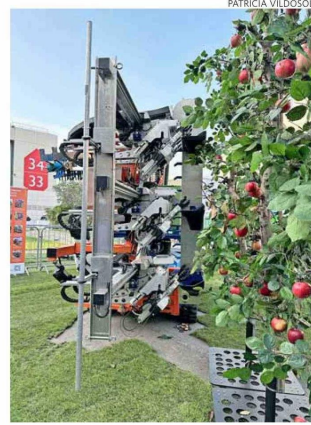
Cosechadoras autónomas de frutas fue parte de lo que se mostró.

complejo, no solo la demanda por mecanización sigue siendo muy alta, sino que además la innovación y nuevas tecnologías se optimizan para permitir que la labor productiva sea cada vez más eficiente y con menor impacto en el entorno”.