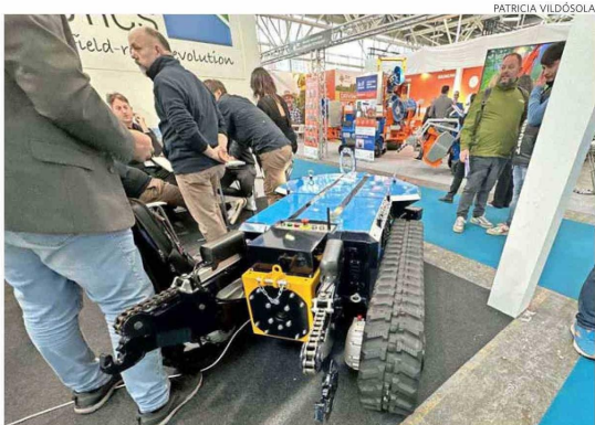
El HammerHead es un robot al que se le pueden adicionar distintos implementos para trabajar el campo.