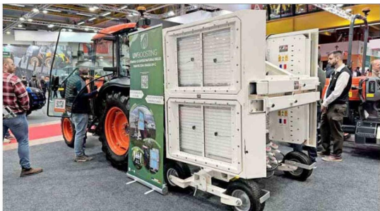
La preocupación por disminuir el uso de insumos ha llevado a desarrollos como el de paneles de luces UV.