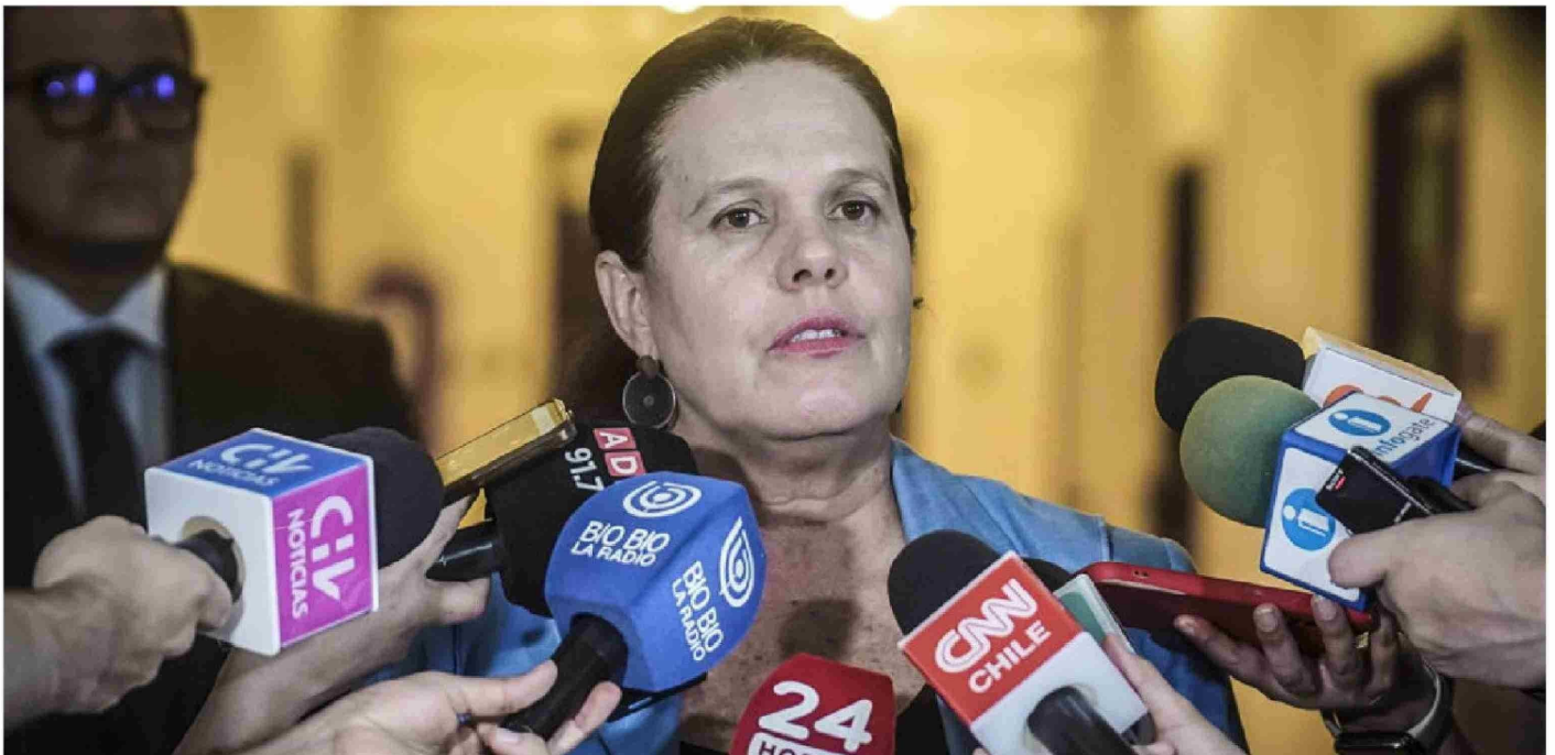
► Maya Fernández (PS), ministra de Defensa.

La secretaria de Estado socialista dio un punto de prensa, tras cuatro días en silencio, sobre la frustrada compra de la vivienda de su abuelo, Salvador Allende. Pese a que reconoció que el proceso no fue bien llevado y reiteró que todo lo dejó en manos del abogado de su familia, parlamentarios de la alianza de gobierno no quedaron conformes y profundizaron sus críticas.