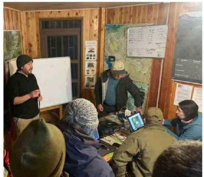
LAS PATRULLAS ESTABLECIERON UN PLAN DE BÚSQUEDA EN LA ZONA.