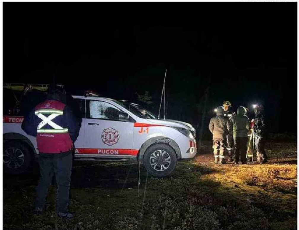
SE REALIZAN TODOS LOS ESFUERZOS PARA DAR CON EL EXCURSIONISTA DESAPARECIDO.

Claudio Moreno iba en busca del camino, pero se pierde y llega a un bosque de quilas desde donde se da cuenta que está extraviado, momento en que le quedaba poca carga de batería en el teléfono. A partir