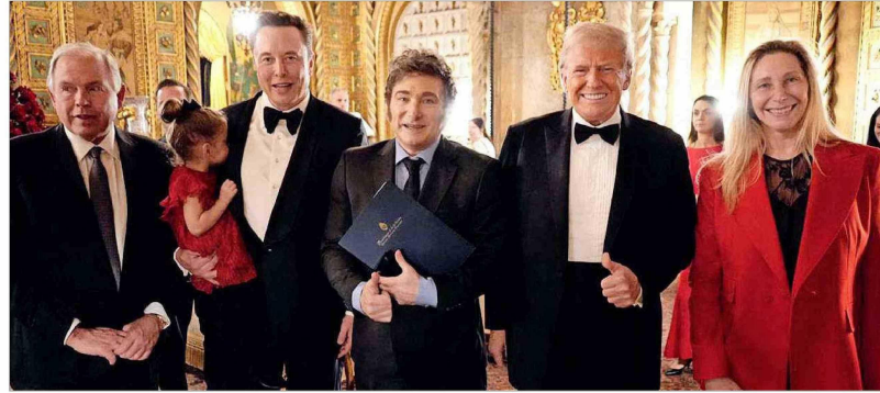
Milei y su hermana Karina, fueron invitados especiales por Trump al cambio de mando, así como Elon Musk, el nuevo zar de la "eficiencia gubernamental".

Y las proyecciones son positivas. El Fon-