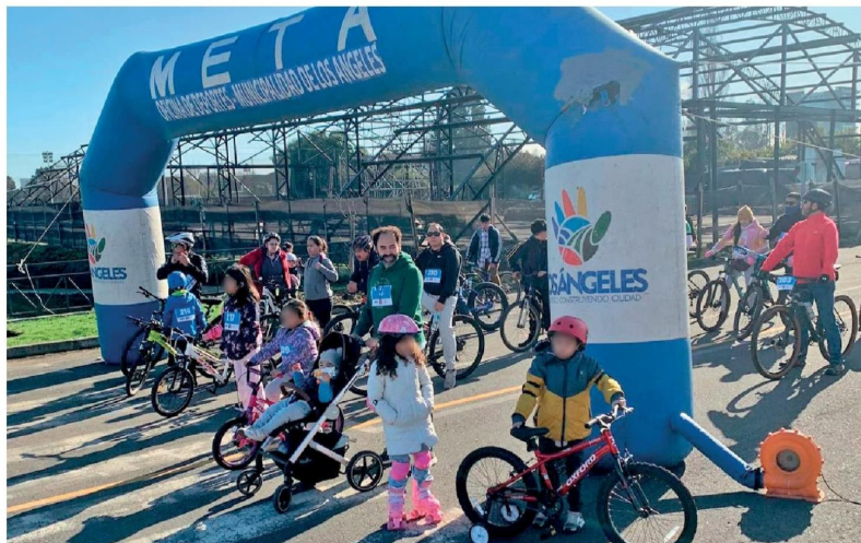
EN SU PRIMERA VERSIÓN la rodada de salud familiar convocó a decenas de participantes.

Según explicaron los profesionales, esta actividad consiste en realizar una ruta recreativa en cualquier vehículo con ruedas, sin motor, es decir, a tracción humana, como bicicletas, scooter, skate, sillas de ruedas, coches de bebé. "La idea es que este recorrido sea lo más inclusivo posible pues la actividad física es muy importante para todos y todas", apuntaron.