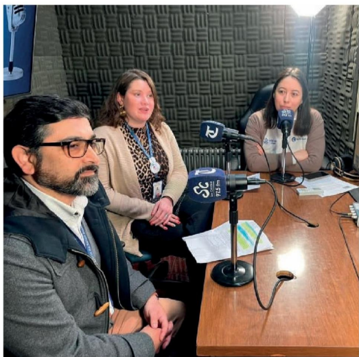
PROFESIONALES DEL SERVICIO DE SALUD BIOBÍO llamaron a la comunidad de toda la provincia, a participar del evento deportivo recreativo.

Al mismo tiempo, que valoraron la participación en el evento del Team BBC Los Ángeles, al Club Trail Mountain, con sus dos agrupaciones de ciclistas angelinos y al Club de Basquetbol NBA Los Ángeles, todos colaboradores de la actividad.