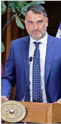
Senador Javier Macaya, presidente de la UDI.