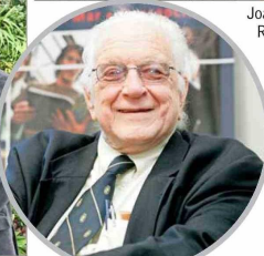
Arnold Harberger es un reconocido profesor de los departamentos de Economía de la Universidad de Chicago y UCLA, quien además fue mentor de destacados economistas chilenos.