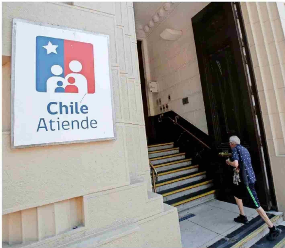
ChileAtiende, como la puerta de entrada a beneficios y servicios del Estado, es altamente valorado.