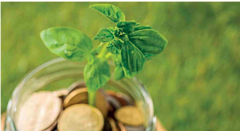
LA BAJA EN LA POSTERGACIÓN o liquidación de las inversiones agrícolas, según el gremio agrícola nacional, es una señal de mayor confianza en la actividad agrícola nacional.

En materia de seguridad, si bien reconoció el aporte del estado de excepción constitucional, y las leyes de usurpación y de robo de madera, advirtió que “las bandas de crimen organizado se desplazaron a los sectores rurales una vez que se creó el plan Calle Sin Violencia en las zonas urbanas. Por lo tanto, necesitamos un mayor despliegue policial urgente”.