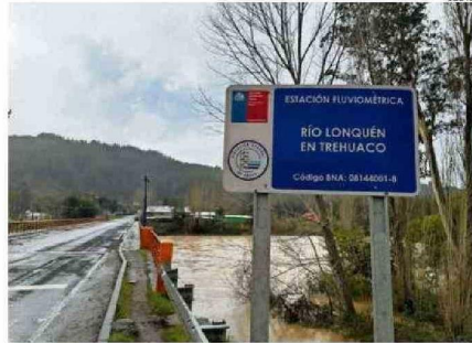
SE EMITIÓ ALERTA ROJA POR CRECIDA EN RÍO LONQUÉN.