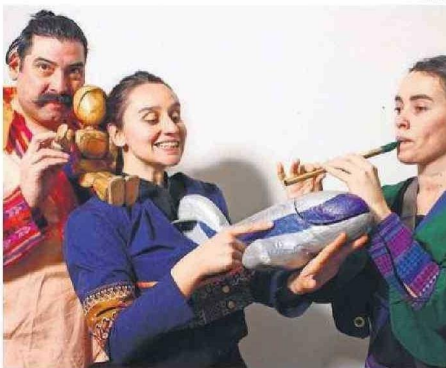
LA CITA CON "ESTUARIO" SERÁ HOY EN EL PARQUE CROACIA.

Antofagasta y Tocopilla recibirán hoy y mañana, respectivamente, obras que serán parte de la amplia cartelera que ofrecerá el tradicional evento hasta el viernes 31.