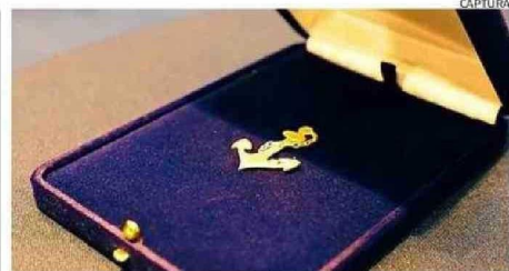
El premio reconoce a personas que han contribuido a la comuna.

Se estima que en el proyecto se extraigan 562,7 millones de toneladas de roca, de las cuales 237,1 millones corresponderán a mineral procesable y 325,6 millones a material estéril.