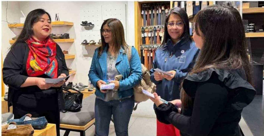
EN LA REGIÓN, QUIENES REQUIERAN MAYOR INFORMACIÓN O QUIERAN HACER DENUNCIAS POR INFRACCIÓN A LA NORMA, PUEDEN COMUNICARSE A LOS CANALES INSTITUCIONALES.

NORMATIVA Por parte de la Dirección del Trabajo, su directora regional,