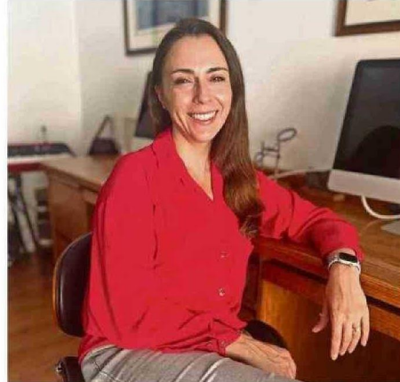
CHURRUCA ES UNA DE LAS AUTORAS DE LA INVESTIGACIÓN.

En esa línea, la especialista plantea que “a diferencia de otros métodos como la saliva, la orina o la sangre, el análisis de uñas permite evaluar el estrés acumulado durante un período prolongado. Esto lo convierte en una herramienta más fiable para entender la carga de estrés crónica, evitando fluctuaciones momentáneas que pueden influir en métodos más tradicionales. La elección de este biomarcador garantiza resultados más representativos y adaptados al contexto académico militar”.