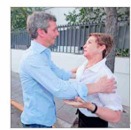
La lista liderada por el exdirector del Sence se impuso con el 57% de los votos, contra un 40% de la actual timonea, Gloria Hutt.

Intercambian 200 prisioneros por cuatro rehenes En un segundo intercambio desde que acordaron un alto el fuego, Israel liberó ayer a 200 prisioneros palestinos a cambio de cuatro mujeres militares que permanecían secuestradas por la milicia de Hamas en la Franja de Gaza desde octubre de 2023. Es un “momento muy feliz que hemos estado esperando durante mucho tiempo”, dijo el Primer Ministro de Israel, Benjamin Netanyahu, quien aseguró que trabajan para “liberar a todos los demás”. | A 5