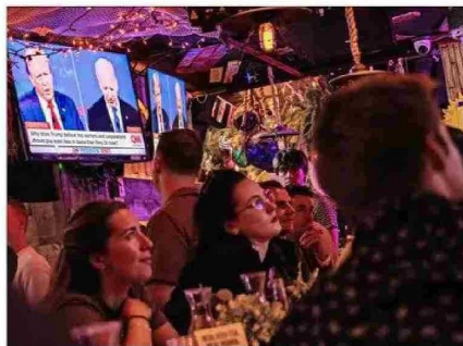
EL DEBATE entre Biden y Trump fue seguido por millones de personas.

junto con plantear que hay varias alternativas, como el gobernador de Illinois, J. B. Pritzker, o el de California, Gavin Newsom. Esas opciones, sin embargo, “no son tan conocidas” debido a que las figuras de Biden y Trump “han frenado la renovación”, manifestó. Por lo que, dice, el mal desempeño de Biden en el debate podría “acelerar el proceso de renovación en el Partido Demócrata”.