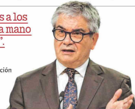
MARIO MARCEL Ministro de Hacienda habló sobre la remoción del jefe del SEA nortino que rechazó millonario proyecto de Colbún en Taltal.

"A veces hay funcionarios a los que se les pasa un poco la mano en estos procedimientos".