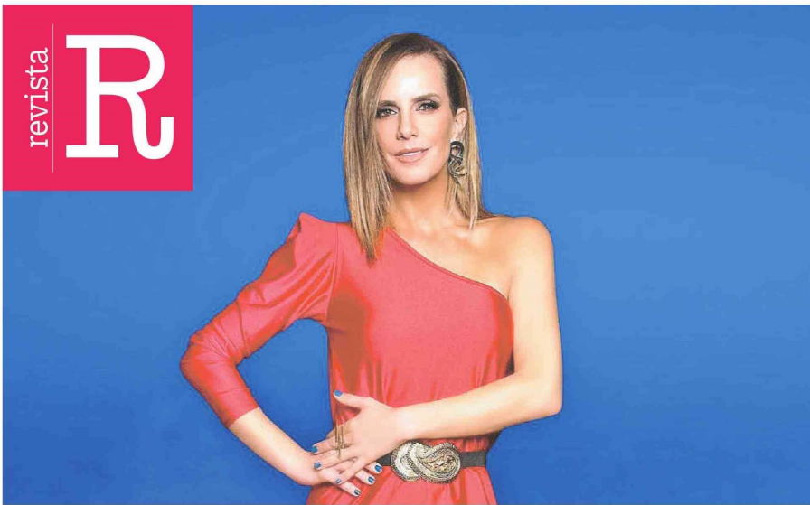
Reality. Diana Bolocco estará al frente de "Gran hermano 2" en Chilevisión.