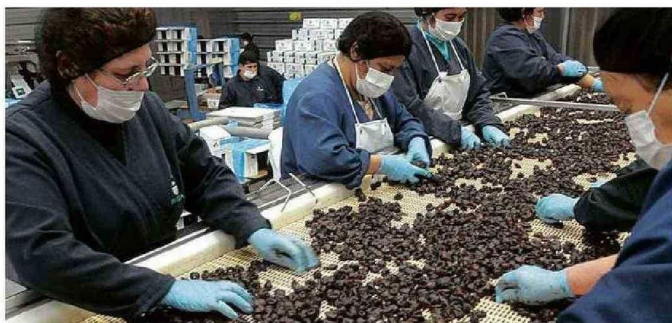
SUJETOS ROBARON 59 MILLONES EN CIRUELAS DESHIDRATADAS QUE IBAN AL EXTRANJERO.