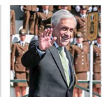
De concretarse la iniciativa, sería el exmandatario que obtendría más rápido el reconocimiento.

Cuestionan uso de recursos de la entidad: recibe $47 millones al mes y tiene 16 funcionarios, pese a estar inutilizable hace más de cinco años. | C 5