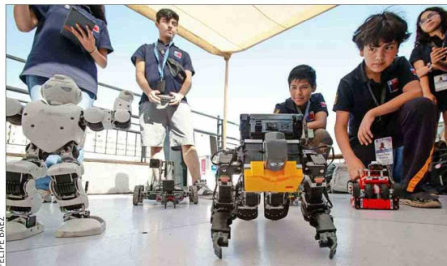
El equipo de robótica Fénix mostró varios robots con los que compiten en Chile y en el extranjero. Hace poco viajaron a Japón representando al país.