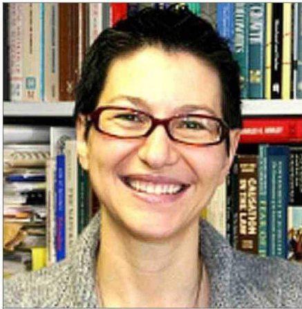
TRINITY UNIVERSITY SAN ANTONIO TEXAS