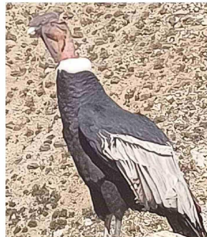
El cóndor es el ave nacional de Chile y vuela planeando corrientes de aire, pudiendo llegar a los 8 mil metros de altura y alcanzar velocidades de hasta 50 kilómetros por hora.

El cóndor es un ave de carroña que vive en las zonas cordilleranas de todo el país. Se caracteriza por su gran tamaño, ya que puede medir hasta 1 metro 30 centímetros de altura y puede llegar hasta los 3 metros con sus alas extendidas. Pesa alrededor de 12 kilos y tiene un anillo de plumas blancas en su cuello y punta de sus alas. Es el ave nacional de Chile y vuela planeando corrientes de aire, pudiendo llegar a los 8 mil metros de altura y alcanzando velocidades de hasta 50 kilómetros por hora.