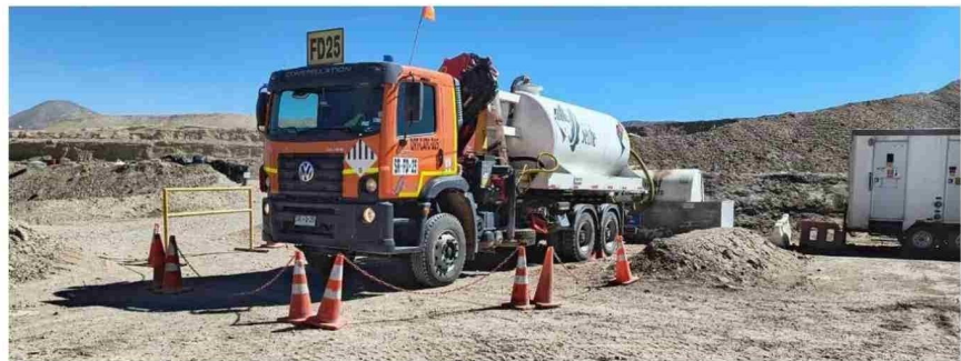
El transporte es parte de la gestión integral de residuos mineros que realiza la empresa.