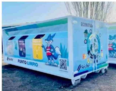
Con la instalación de puntos limpios se promueve la economía circular.