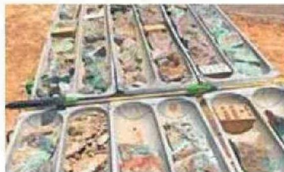
LA MINERA ESTÁ EMPLAZADA EN MEJILLONES.