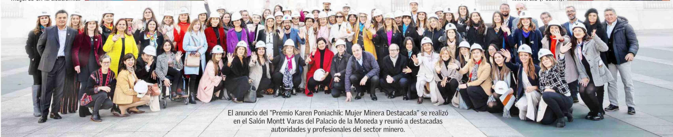
El anuncio del "Premio Karen Poniachik: Mujer Minera Destacada" se realizó en el Salón Montt Varas del Palacio de la Moneda y reunió a destacadas autoridades y profesionales del sector minero.