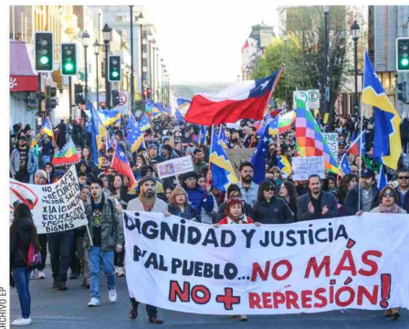
Muchas protestas pacíficas se realizaron también en demanda de reivindicaciones sociales.