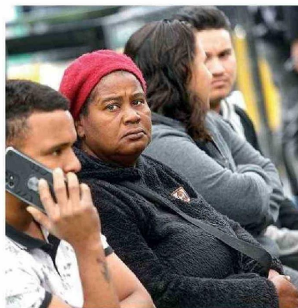
LA REGIÓN CONCENTRA CASI 60 MIL MUJERES MIGRANTES.

Este fenómeno de la baja natalidad chilena se ha ido