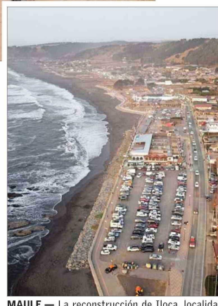
MAULE.— La reconstrucción de Iloca, localidad costera totalmente arrasada el 27-F por el sismo y las olas.

"lamentablemente, muchos de los desastres afectan a población vulnerable debido a su exposición, ubicada irregularmente en zonas de riesgo y sin las debidas mitigaciones". Undurraga plantea que "las actualizaciones en curso de las políticas nacionales de planificación urbana, rural y