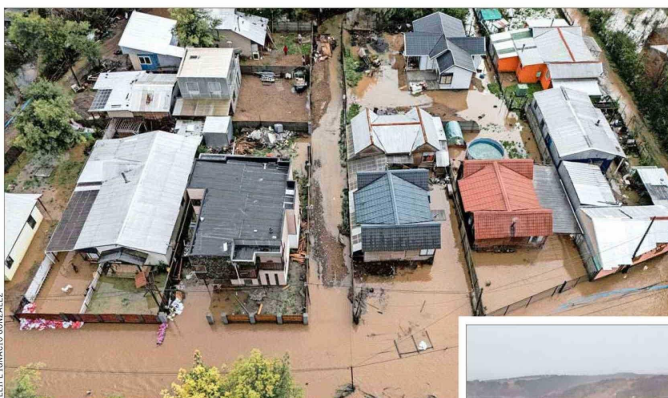
CONCEPCIÓN.— En los sistemas frontales que en varias etapas de cada invierno llegan a la capital de Biobío son recurrente los desbordamientos del río Andalién y la inundación de zonas pobladas.

SERGIO BAERISWYL PREMIO NACIONAL DE URBANISMO