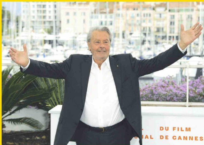
Au revoir, monsieur Alain Delon. La muerte del gran actor enluta a los franceses y al cine mundial.

Emblema. A los 88 años falleció la estrella francesa del cine, que tuvo una magnífica trayectoria gracias a su talento y apostura.