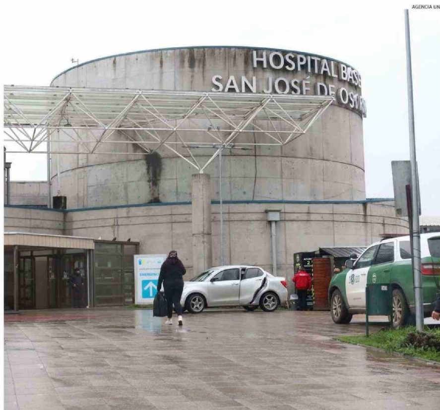
EL HOSPITAL BASE CONCENTRA GRAN PARTE DE LAS ATENCIONES POR ENFERMEDADES RESPIRATORIAS EN ESTAS SEMANAS.

No obstante, a pesar de que se han pesquisado pocos casos de influenza, desde el Servicio de Salud (SSO) advierten que los contagios podrían aumentar en las próximas semanas, por lo que es muy importante inocularse con la vacuna con-