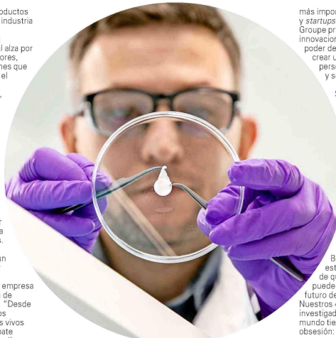
L'Oréal Groupe presentó recientemente Skin Technology, una innovación que utiliza modelos de piel bioimpresos para simular diversas condiciones dermatológicas.

Una de las creaciones de la compañía más destacadas en este ámbito es EpisKin, herramienta que permite analizar cómo los ingredientes interactúan con la dermis humana, estableciendo nuevos estándares en investigación dermatológica. Esta tecnología no solo ha sido aprobada por la Comisión Europea, sino que también se ha convertido en un recurso disponible para otras empresas, gobiernos y organizaciones que buscan alternativas al testeo animal.