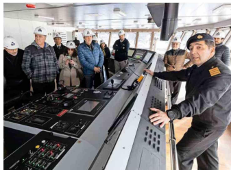
Delegación conoce detalles de la sala de control del buque.