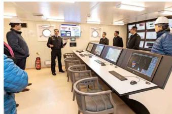
El rompehielos cuenta con salas de procesamiento de información de sensores y laboratorios, entre otras prestaciones.