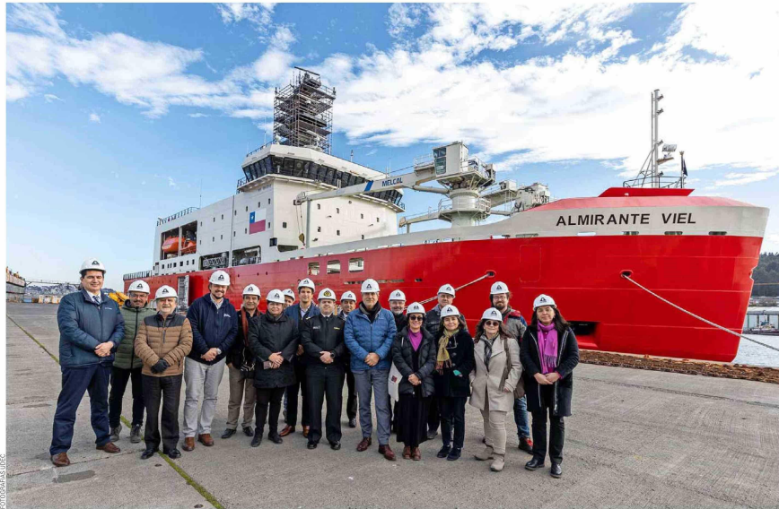
Autoridades e investigadores UdeC frente a rompehielos en la Base Naval de Talcahuano.

"Este buque fue diseñado para potenciar la capacidad científica, principalmente en el área antártica, y representa una alianza fundamental entre la Armada y las instituciones de investigación. La