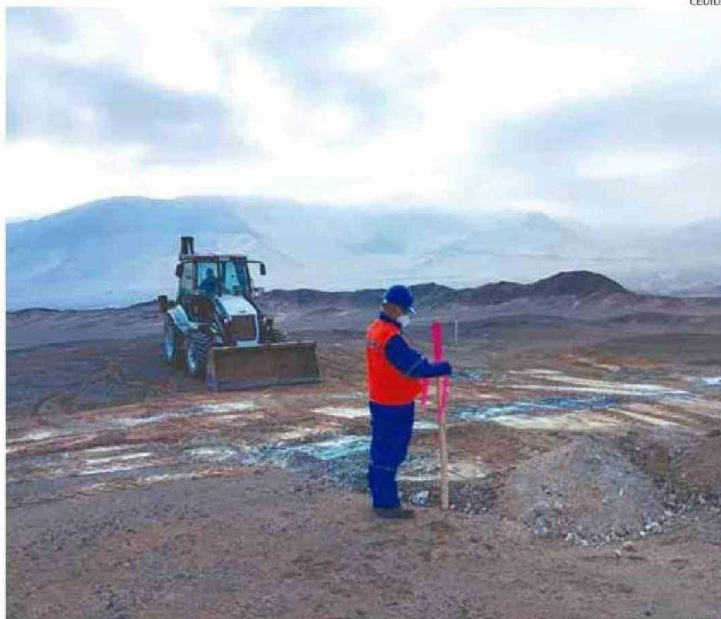
EL INFORME PERICIAL PRESENTADO EN EL JUICIO DESTACÓ LAS OBRAS DE EXPLORACIÓN MINERA EN CALETA BOLFIN.