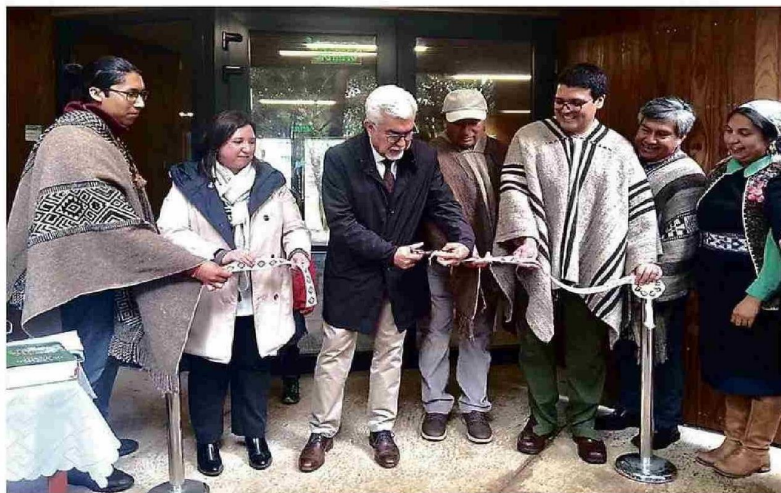
Con la presencia de autoridades universitarias y ancestrales del territorio se inauguró el Centro de Documentación, Enseñanza y Aprendizaje de la Lengua Mapuche, Kimeltuwpeñ.

Dicho compromiso fundacional trazó el camino de la casa de estudios, que en la actualidad representa un eje central de su misión en cada uno de los espacios de la universidad, como un puente que conecta el acceso a la educación con el desarrollo integral de la región, propósito que trasciende entre cada uno de los integrantes de la comunidad universitaria.