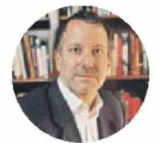
MARIO MARCEL Ministro de Hacienda

Va a generar más disponibilidad de fondos para financiar proyectos de inversión y financiar proyectos de vivienda”.