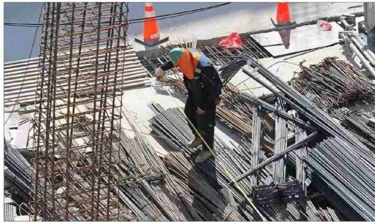
En 2024, el aporte acumulado de la productividad del país al crecimiento económico ha sido de -1,4 puntos porcentuales, según cálculos del centro de estudios.

Para calcular las variaciones de la productividad se requiere conocer la tasa de crecimiento de la economía, el nivel de recursos para producir bienes y servicios (stock de capital), y trabajo. En el tercer trimestre de este año, el PIB aumentó 2,3% anual, mientras el stock de capital subió un 3,9% y el empleo avanzó en 2,4% en igual periodo.