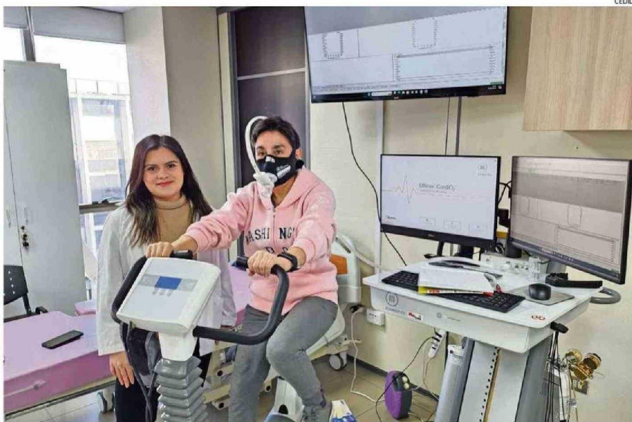
LAS PARTICIPANTES REALIZAN UNA SERIE DE RUTINAS, ENTRE ELAS DE TIPO INTERVÁLICO DE INTENSIDAD VIGOROSA EN UNA BICICLETA ESTÁTICA.

Tanto este tipo de cáncer como otras patologías cardiovasculares se agravan por el sedentarismo, que es la falta de actividad física y un estilo de vida inactivo. Esto es, detalla Álvarez, en no practicar actividad física de baja a mode-